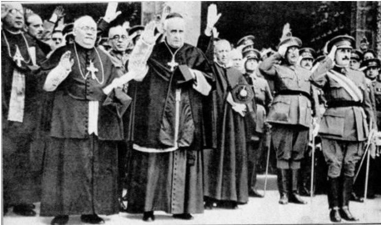
گروهی از روحانیان نزدیک به مقام معظم رهبری در حال ادای احترام فاشیستی

دوران کوتاه جمهوری دوم را در تاریخ اسپانیا را می توان عصر طلایی شکوفایی دموکراسی در این کشور دانست. متأسفانه، تندروی نیرو های چپ در انجام اقدامات ضد مذهبی، موجب کاهش محبوبیت شان در میان توده های مردم عادی و از دست دادن پشتیبانی توده ای آنان شد. سوسیالیست ها و کمونیست های این دوره، علاوه بر گنجاندن موادی ضد کلیسایی و ضد مذهبی در قانون اساسی سال ۱۹۳۱ - که جمهوری دوم را، جمهوری همه کارگران می نامید- تندیس های حضرت مسیح را هم از کلیسا ها بیرون آوردند و با بستن به پشت جیب، در خیابان ها بر روی زمین کشیدند. و یا شمایل مُقَدَّس را در ملاء عام و در جلو چشم مردم آتش زدند و کلیسا ها و صومعه ها را طعمه حریق ساختند.