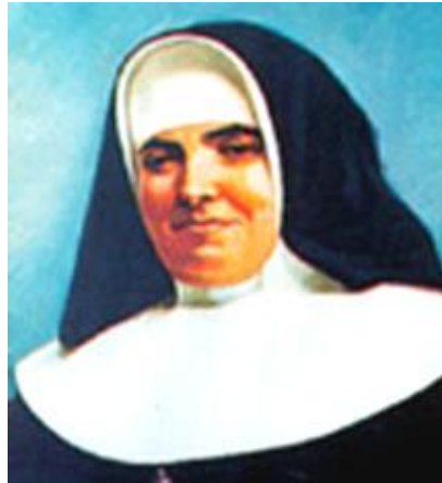
قدیسهء شهید روساریو د سوانو که در ۱۹۳۶ به دست نیرو های چپ تیرباران شد Beata Rosario de Soano

رفته، رفته، روحانیان کار مداخله در زندگی خصوصی و روزمرهء مردم کوچه و بازار را در اسپانیا به جایی رساندند که سرانجام، جان مردم به لبشان رسید. تر و خشک را با هم سوزاندند و فقط در دورهء هشت سالهء حکومت جمهوری دوم اسپانیا، ۶۸۱۵ تن از روحانیان و مقامات کلیسا را به جوخه های اعدام سپردند. ۶۸۱۵ نفر، رقمی مبتنی بر حدس و شایعه نیست، بلکه اسامی و